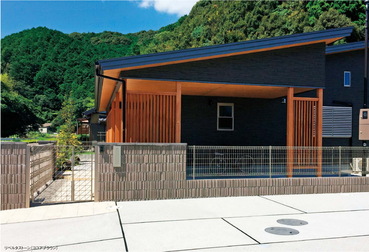
リベルタストーン(ココアブラウン)